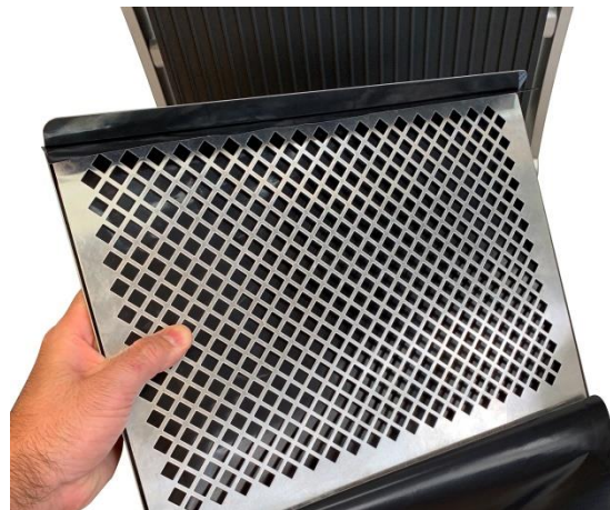
GS6-P1 für/for GSA610S-F