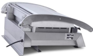
RS830 für/for GSA815