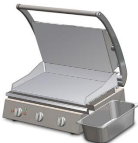
GC835 für/for GSA815