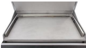
GSPS835 für/for GSA815